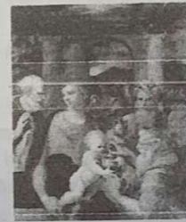
PARMIGIANINO Adorazione dei Magi, 1529 circa